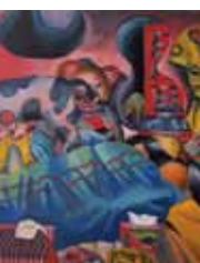
東京藝術大学(油画)合格者作品

初心者には基礎課題を通して描画材料の使い方、性質を理解できるよう丁寧に指導します。受験生には各自の志望大学に合わせカリキュラムを組み、個々の個性に柔軟性を持って対応します。個性を尊重し、感性を磨くことに重点をおいた指導によって、毎年難関校の油画科へ合格者を輩出しています。