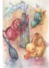
北海道教育大学(美術文化)美術デザイン合格者作品

着彩静物や写生、イメージ着彩表現など、専攻によって受験で求められる表現は異なります。透明水彩、不透明水彩、アクリルガッシュなど画材の特徴や着色技術が異なることを理解し、使いこなせるよう指導します。