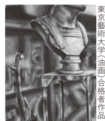
東京藝術大学(油画)合格者作品

ファイン系デッサン、デザイン系デッサンともに基本的な共通要素はありますが、形態の把握や空間、描写の表現方法など異なる点があり、そのポイントをカリキュラムを通してわかりやすく説明します。また、初心者から経験者まで個別指導で確実なレベルアップをはかります。