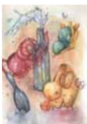
北海道教育大学 美術デザイン(合格者作品)

着彩静物や写生、イメージ着彩表現など、専攻によって受験で求められる表現は異なります。透明水彩、不透明水彩、アクリルガッシュなど画材の特徴や着色技術が異なることを理解し、使いこなせるよう指導します。