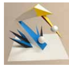
金沢美術工芸大学 (デザイン科)環境(合格者作品)

紙、ボード、バルサ材、竹ひごなどさまざまな素材を用いて作品を制作します。初心者には講師によるデモンストレーションによって素材の特性や加工方法を知り、表現の幅を広げます。受験生には志望校に合わせた対策で、試験時間内に完成度のある作品づくりを目指します。