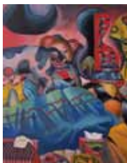
東京藝術大学 油画(合格者作品)

初心者には基礎課題を通して描画材料の使い方、性質を理解できるよう一から丁寧に指導します。受験生には各自の志望大学に合わせカリキュラムを組み、個々の個性に柔軟性を持って対応します。個性を尊重し、感性を磨くことに重点をおいた指導によって、毎年難関校の油画科へ合格者を輩出しています。