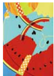
武蔵野美術大学 (視覚伝達デザイン)合格者作品

デザイン系の受験では色彩構成が必須となり、着色の技術、構成力、発想力が問われます。さまざまな課題を通してアイデアの引き出しを増やし、つくられたスタイルではなく、自分だけの構成や色の表現を見つけていけるようサポートします。