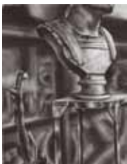
東京藝術大学 油画(合格者作品)

ファイン系デッサン、デザイン系デッサンともに基本的な共通要素はありますが、形態の把握や空間、描写の表現方法など異なる点があり、そのポイントをカリキュラムを通してわかりやすく説明します。また、初心者から経験者まで個別指導で確実なレベルアップをはかります。