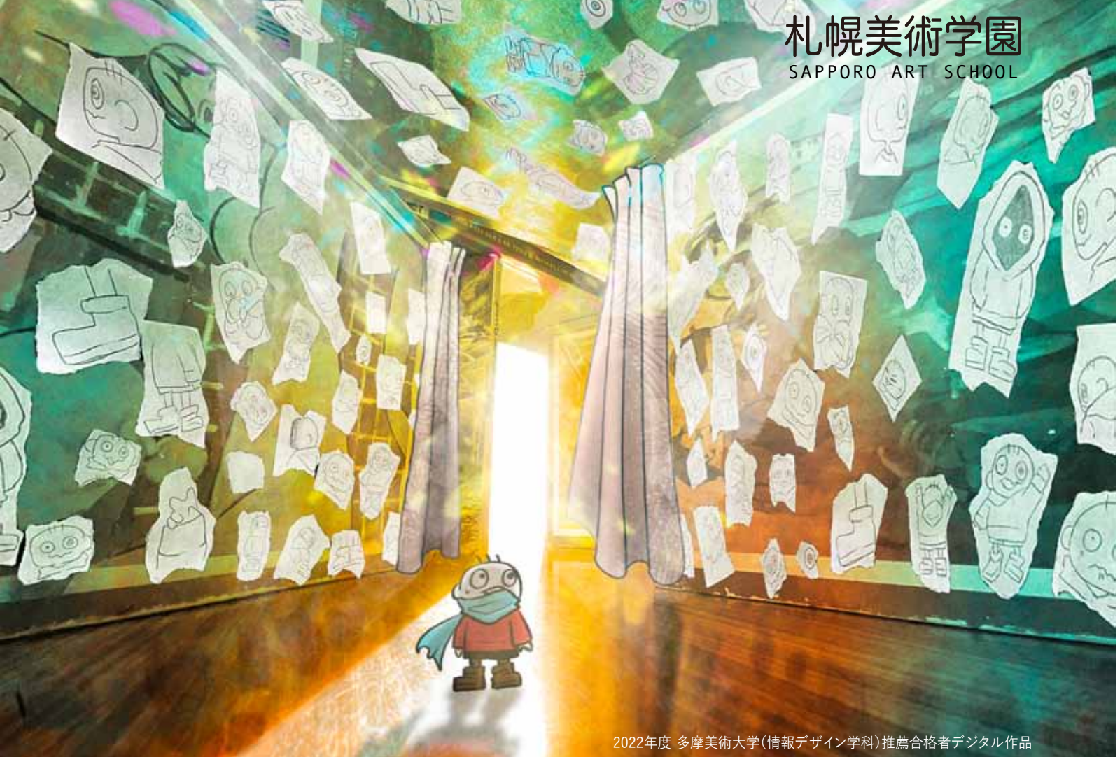
2022年度 多摩美術大学(情報デザイン学科)推薦合格者デジタル作品