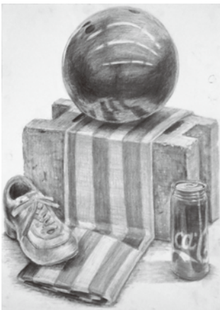
中学生コース作品